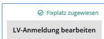
Abb. 1: Anzeige der Fixplatzzusage in RWTHonline

Informationen zur automatischen Buchung von „Studierenden“